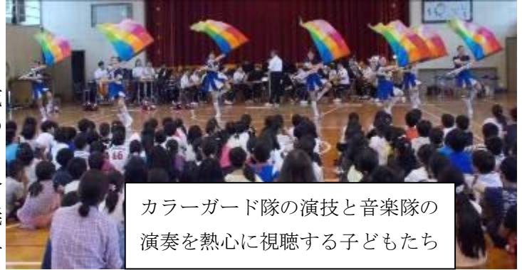
カラーガード隊の演技と音楽隊の演奏を熱心に視聴する子どもたち

20日(金)、本校体育館で、北九州市消防音楽隊による「消防“夢”コンサート」が実施されました。音楽隊の演奏とカラーガード隊の演技等を通じて、防災の大切さや音楽の素晴らしさを赤坂っ子に伝えてくれました。リズム合奏やカラーガードの体験もあり、とても有意義な一時となりました。北九州市消防音楽隊のみなさん、ありがとうございました。