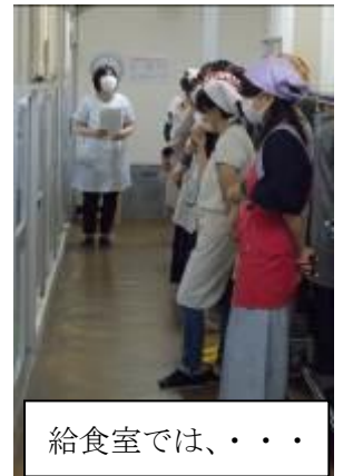
給食室では、・・・

24日(火)にPTAの文教委員会と学年・学級委員会合同による家庭教育学級が実施されました。多くの保護者の方が参加していただき、給食室で調理をしている様子を見学したり、栄養担当教員から給食の目標等について講話を聞いたりしました。当日のメニューはカレーライスでしたが、カレーのルーを給食室で手作りしていることに驚いていたようです。