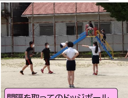
間隔を取ってのドッジボール

ただ、マスクを着用しているので、熱中症が気になります。子ども達には、人がいないところであれば外して涼んだり、呼吸を整えたりするように声かけをしています。遊びに夢中で、水分補給やマスクをはずすことなど忘れてしまうようで、これからも繰り返し指導を行っていくようにしたいと思います。