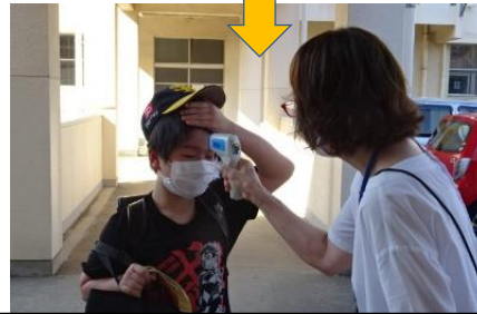
非接触型の体温計で熱を計ります。