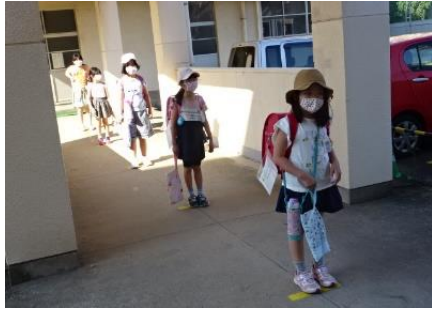
1mの間隔をとって並んで待ちます。

本市では、登校時に「健康チェック」を行っています。本校でも、下記のようにチェックを行い、感染防止に取り組んでいます。職員全員(当番制)で、7:40から一人一人に丁寧な対応を行うようにしています。