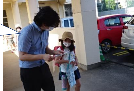
ビニール袋からカードを取り出し、体調について聞き取りをします。