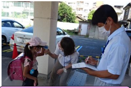
体調を複数の目で確認します。